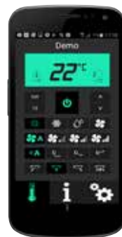
Appstyrning via Wi-Fi ingår. Finns till både Iphone och Android.

*För att garantin ska gälla behöver du serva värmepumpen efter tre år. Regelbunden service gör också att du sänker dina värmekostnader samtidigt som du minskar risken för driftstopp.